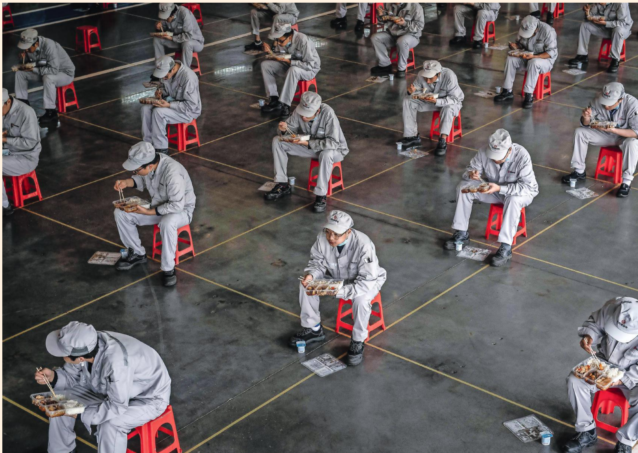
Arbeiders van een autofabriek van Honda in China eten hun lunch. Op de grond is aangeduid waar ze moeten zitten.

en met zijn veelvuldige smartphonetificaties die waarschuwen voor nieuwe broerhaarden in de buurt. Bovendien zijn hygiëne, fysieke afstand en burgerlijke gehoorzaamheid er meer ingebakken.